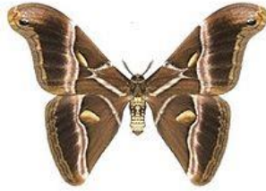
Bombyx de l'ailante