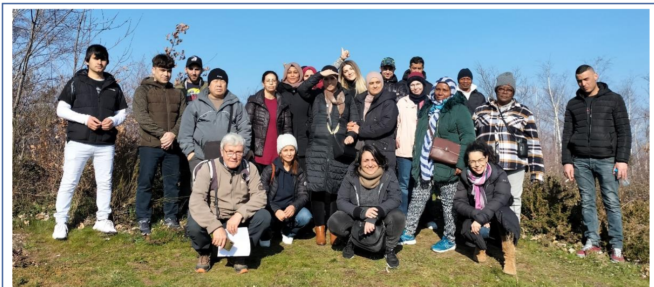
Groupe d'adultes Le Colibri du centre social de la Cotonne en apprentissage du Français 3