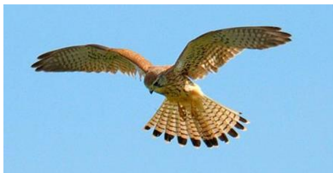
Le vol du Saint-Esprit